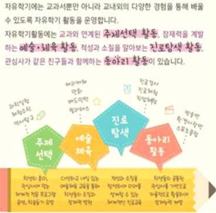
[그림] 자유학기 활동의 교육과정 영역 교육부, 초·중·고 교육과정 (2019), 자유학기 고·중·초·고(자유학기제 안내서).