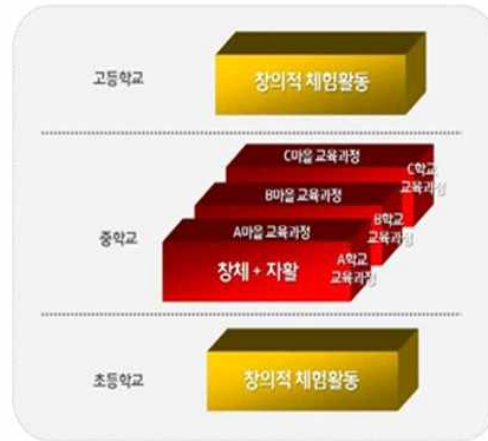
[그림] 중학교 비교과 교육과정 변화 양상 김경애 외(2018), p. 169.