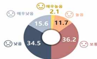
< 고등학교 학생들의 행복 수준('22, KDI) >

* 우울감 경험률(청소년 건강행태조사, %): (2015)23.6→(2017)25.1→(2019)28.2→(2021)26.8→(2022)28.7