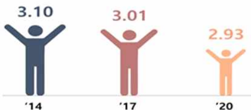
< 학교생활만족도('14~'20, 여성가족부 ) >